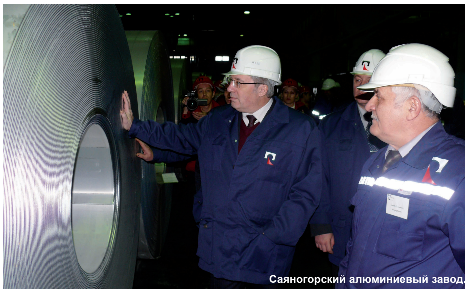
Саяногорский алюминиевый завод.

Одновременно Сибирь — это ещё и большая концентрация науки и интеллекта. В Новосибирске и Томске расположены уникальные научные центры. И надо отметить, что число