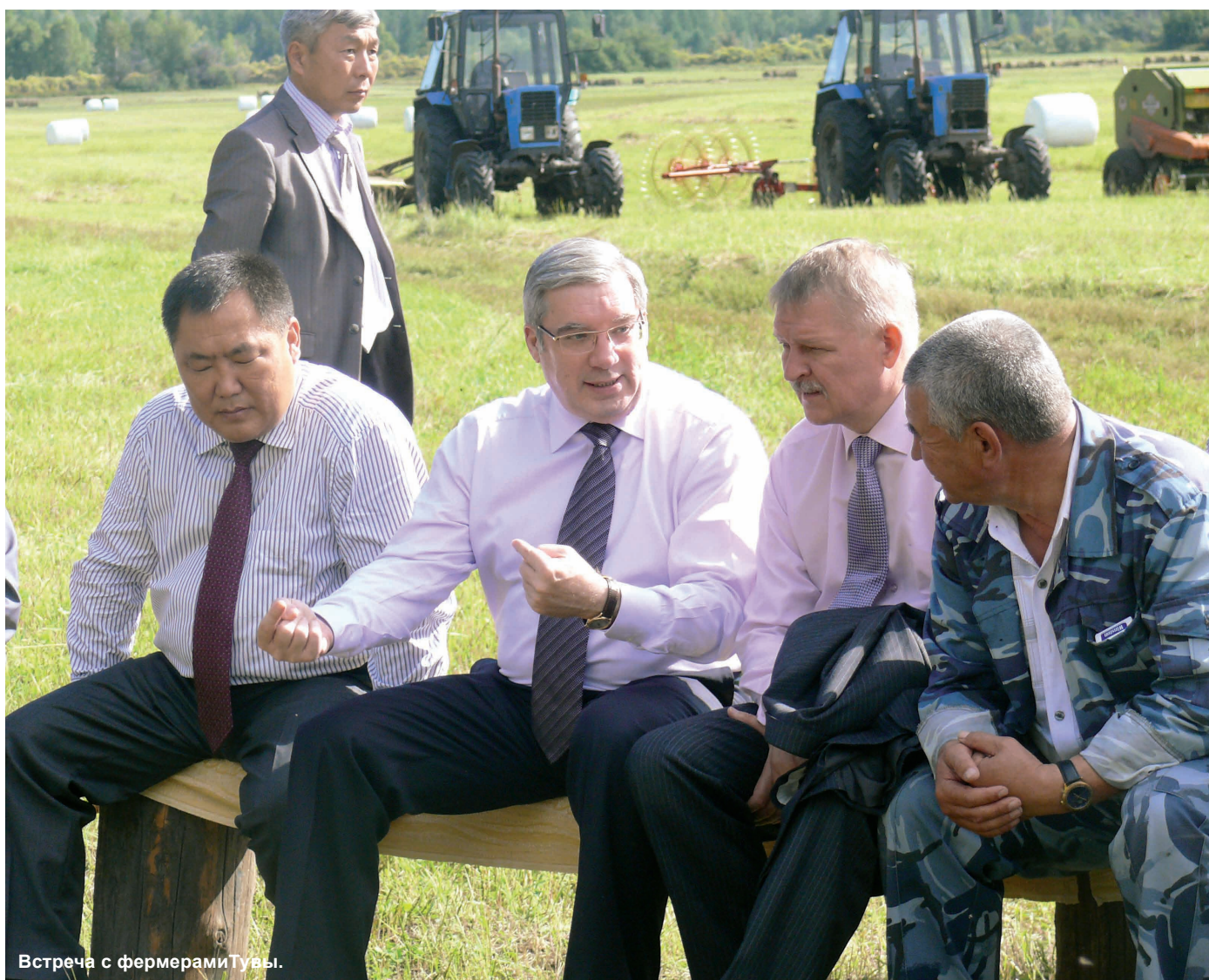
Встреча с фермерами Тувы.

— Сибирякам уже недостаточно устойчивой связи только с Москвой и другими крупными центрами. У нас как минимум три региона, внутри ➡