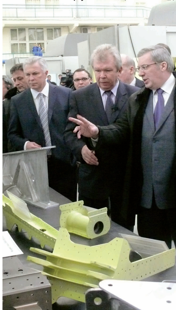
Иркутский авиационный завод.

ными, их опыт заслуживает распространения на всю Россию. У нас Арктический север, Северный ледовитый океан, Северный морской путь... Если мы будем разумно строить свою собственную политику, то нет никаких сомнений — в Сибири будут и государственные, и частные инвестиции. ■