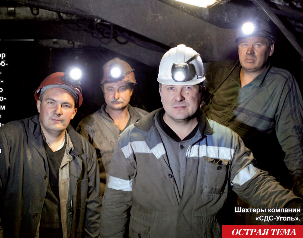
Шахтеры компании «СДС-Уголь».