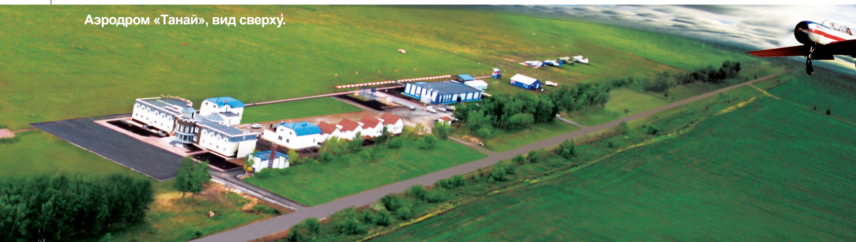
Аэродром «Танай», вид сверху.