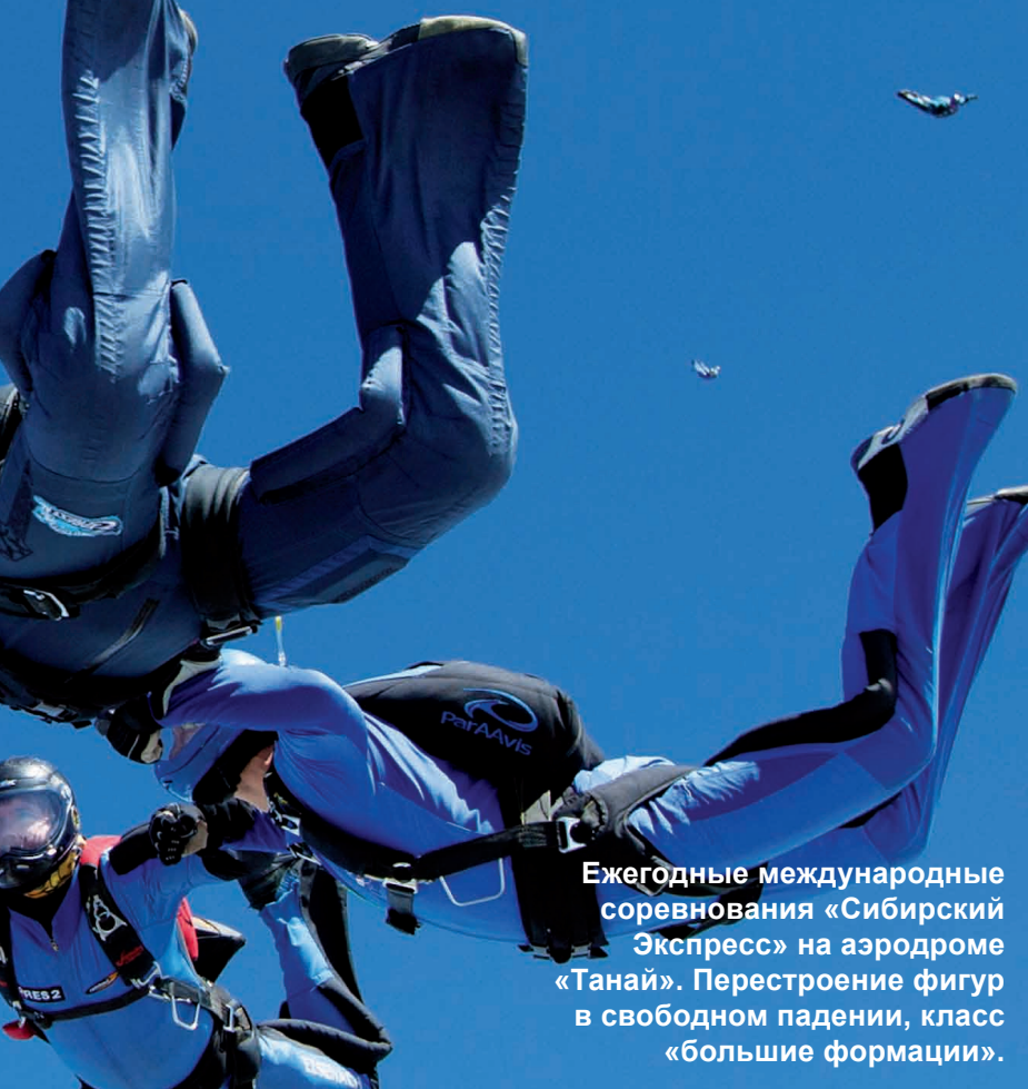
Ежегодные международные соревнования «Сибирский Экспресс» на аэродроме «Танай». Перестроение фигур в свободном падении, класс «большие формации».