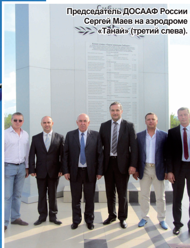
Председатель ДОСААФ России Сергей Маев на аэродроме «Танай» (третий слева).