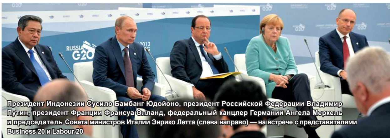
Президент Индонезии Сусило Бамбанг Юдойоно, президент Российской Федерации Владимир Путин, президент Франции Франсуа Олланд, федеральный канцлер Германии Ангела Меркель и председатель Совета министров Италии Энрико Летта (слева направо) — на встрече с представителями Business 20 и Labour 20

В результате скоординированной работы были приняты решения по приоритетным вопросам повестки дня, в том числе таким, как обеспечение макроэкономической стабильности, привлечение долгосрочных инвестиций в инфраструктуру, создание качественных рабочих мест, совершенствование финансового регулирования. Важной составляющей этого успеха председательства стала система структурированных диалогов с партнёрами «двадцатки» — аутрич-группами.