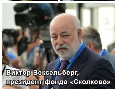
Виктор Вексельберг, президент фонда «Сколково»