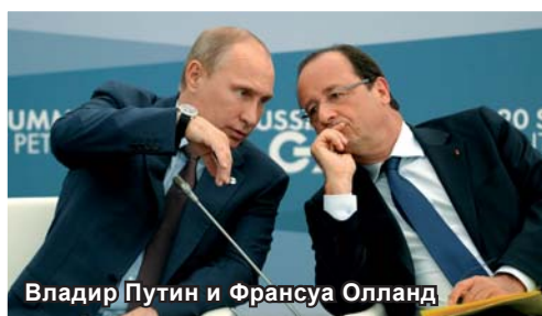
Владир Путин и Франсуа Олланд