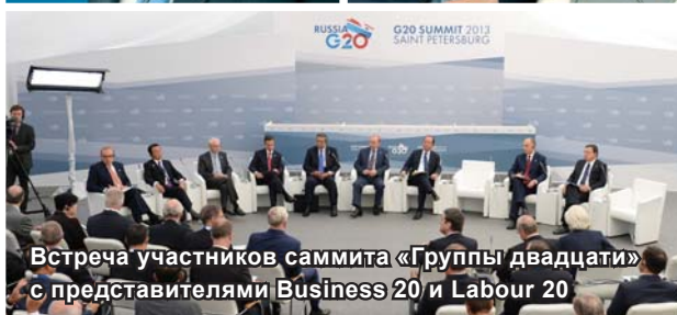
Встреча участников саммита «Группы двадцати» с представителями Business 20 и Labour 20