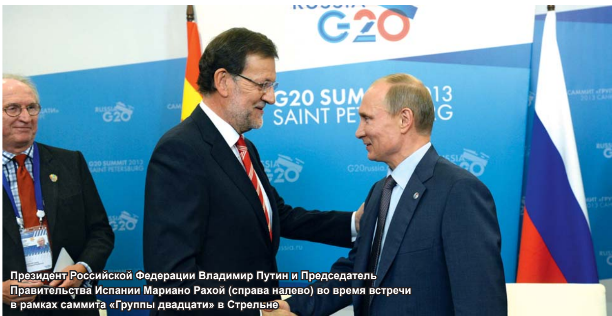
Президент Российской Федерации Владимир Путин и Председатель Правительства Испании Мариано Рахой (справа налево) во время встречи в рамках саммита «Группы двадцати» в Стрельне

Сеуле, 2011 г. в Каннах и 2012 г. в Лос-Кабосе (Мексика).