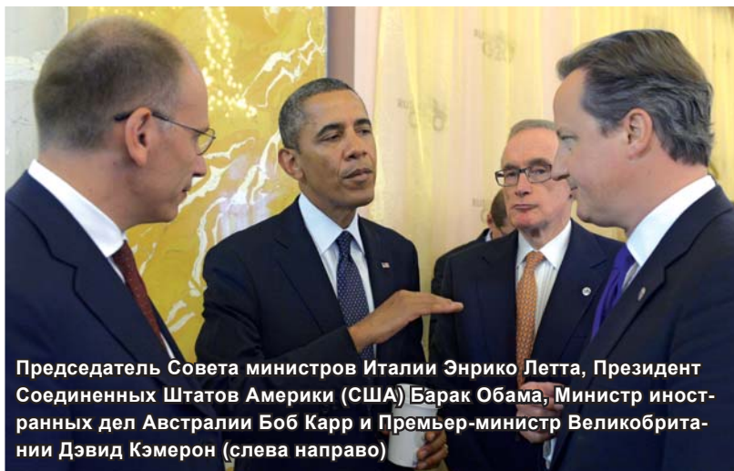
Председатель Совета министров Италии Энрико Летта, Президент Соединенных Штатов Америки (США) Барак Обама, Министр иностранных дел Австралии Боб Карр и Премьер-министр Великобритании Дэвид Кэмерон (слева направо)