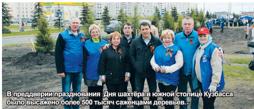
В преддверии празднования Дня шахтёра в южной столице Кузбасса было высажено более 500 тысяч саженцами деревьев.

ливо, это электроэнергия и тепло», — подчеркнул Президент страны Владимир Путин.