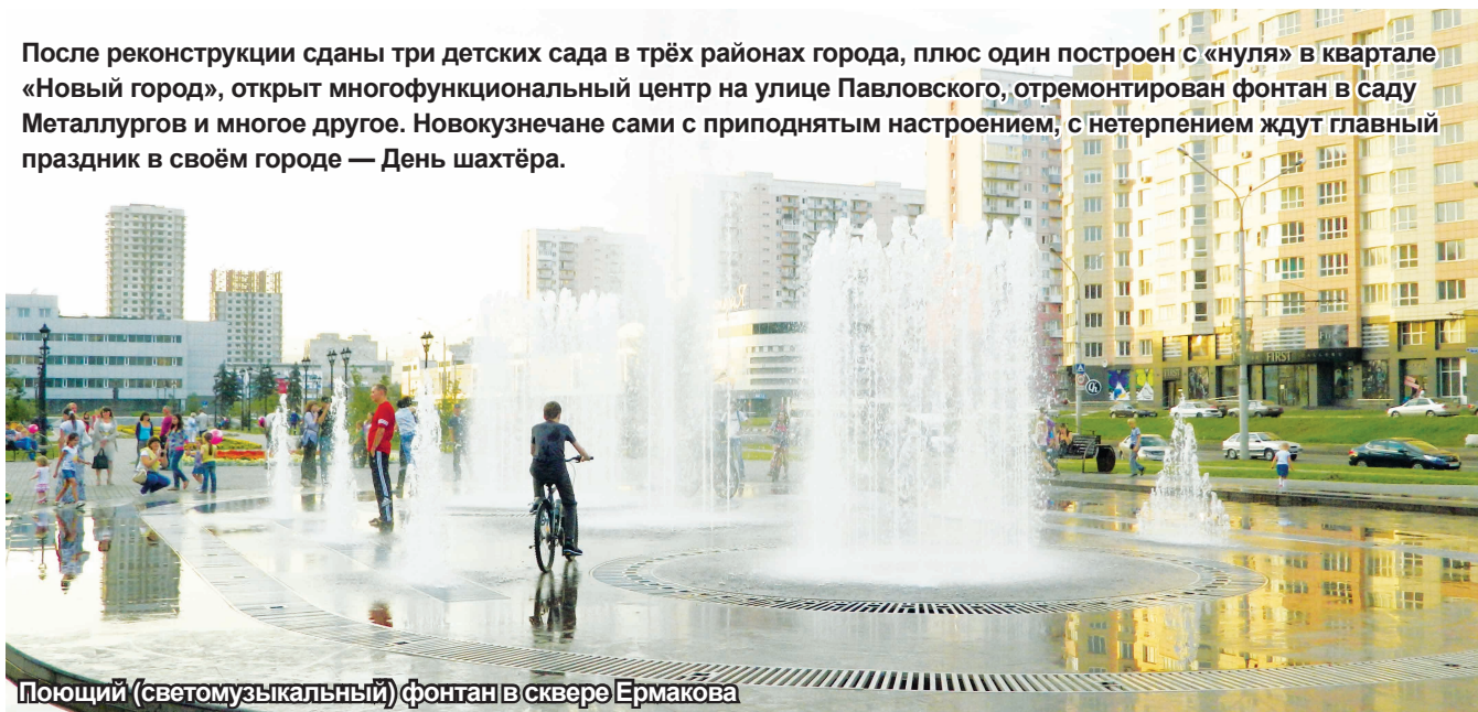
Поющий (светомузыкальный) фонтан в сквере Ермакова

После реконструкции сданы три детских сада в трёх районах города, плюс один построен с «нуля» в квартале «Новый город», открыт многофункциональный центр на улице Павловского, отремонтирован фонтан в саду Металлургов и многое другое. Новокузнецкие сами с приподнятым настроением, с нетерпением ждут главный праздник в своём городе — День шахтёра.