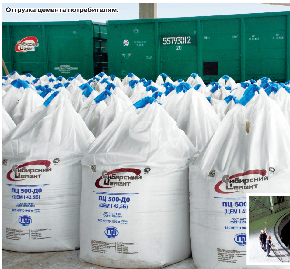
Отгрузка цемента потребителям.

Столь же серьезное внимание уделяет холдинг программам обеспечения безопасных условий труда. Основные направления этой деятельности — охрана здоровья сотрудников, обеспечение безопасности на рабочем месте, контроль над соблюдением графика труда и отдыха. ■