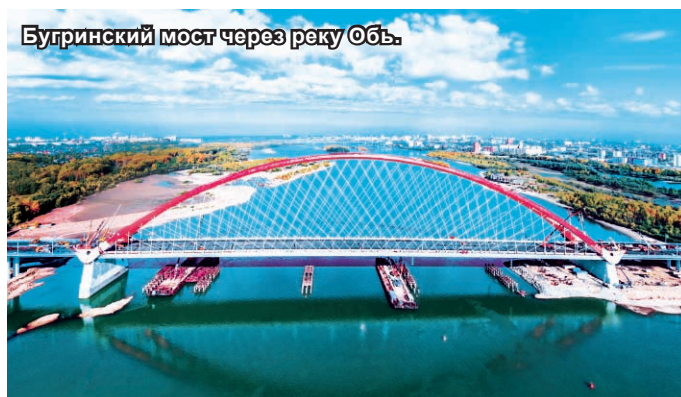
Бугринский мост через реку Обь.

Конечно, насущным вопросом остается создание социальных условий для молодых ученых. Но и в этом направлении за последние годы сделано немало. Так, СО РАН предоставляло служебное жилье молодым ученым и сотрудникам, выдавало сертификаты на покупку жилья. Сейчас в связи с некоторыми реорганизационными процедурами для продолжения реализации мер поддержки требуется время для