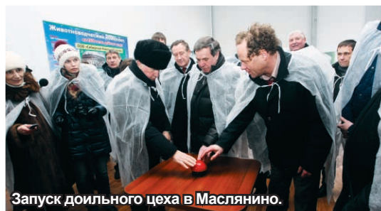
Запуск доильного цеха в Маслянино.

них является Сибирская биотехнологическая инициатива. Вместе с коллегами из Томской и Кемеровской областей, Алтайского и Красноярского краев мы беремся за возрождение и модернизацию биотехнологической отрасли. В наших регионах сохранилась неплохая производственная база. В Новосибирской области это «Сиббиофарм» и предприятия, возникшие вокруг Центра «Вектор».