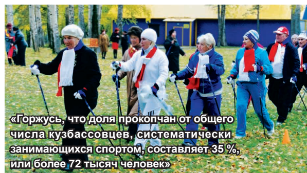
«Горжусь, что доля прокопчан от общего числа кузбассовцев, систематически занимающихся спортом, составляет 35 %, или более 72 тысяч человек»

— В вашей команде инициатива приветствуется?