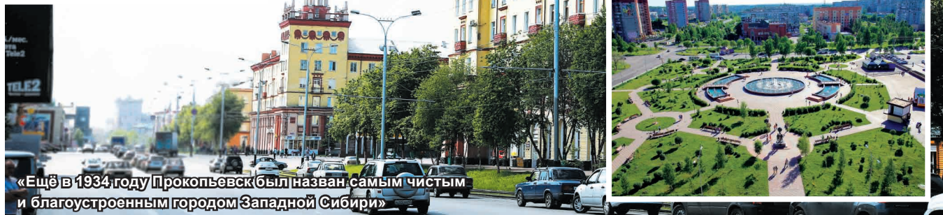
«Ещё в 1934 году Прокопьевск был назван самым чистым и благоустроенным городом Западной Сибири»

Кузбасс и за каждого его жителя, огромное спасибо от всех прокопчан.