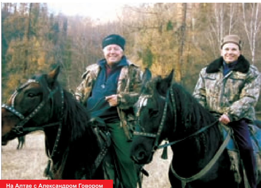
На Алтае с Александром Говором

жа: когда-то там начинал, выступая с концертами. Но я сибиряк и люблю свою родину, здесь мои корни. Здесь мы с ребятами создали группу «Регион 42». Причём сначала появилась песня с этим названием, а потом родилась идея дать такое название группе.